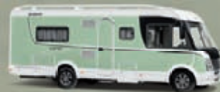
ESPRIT Integroidut sivu 68