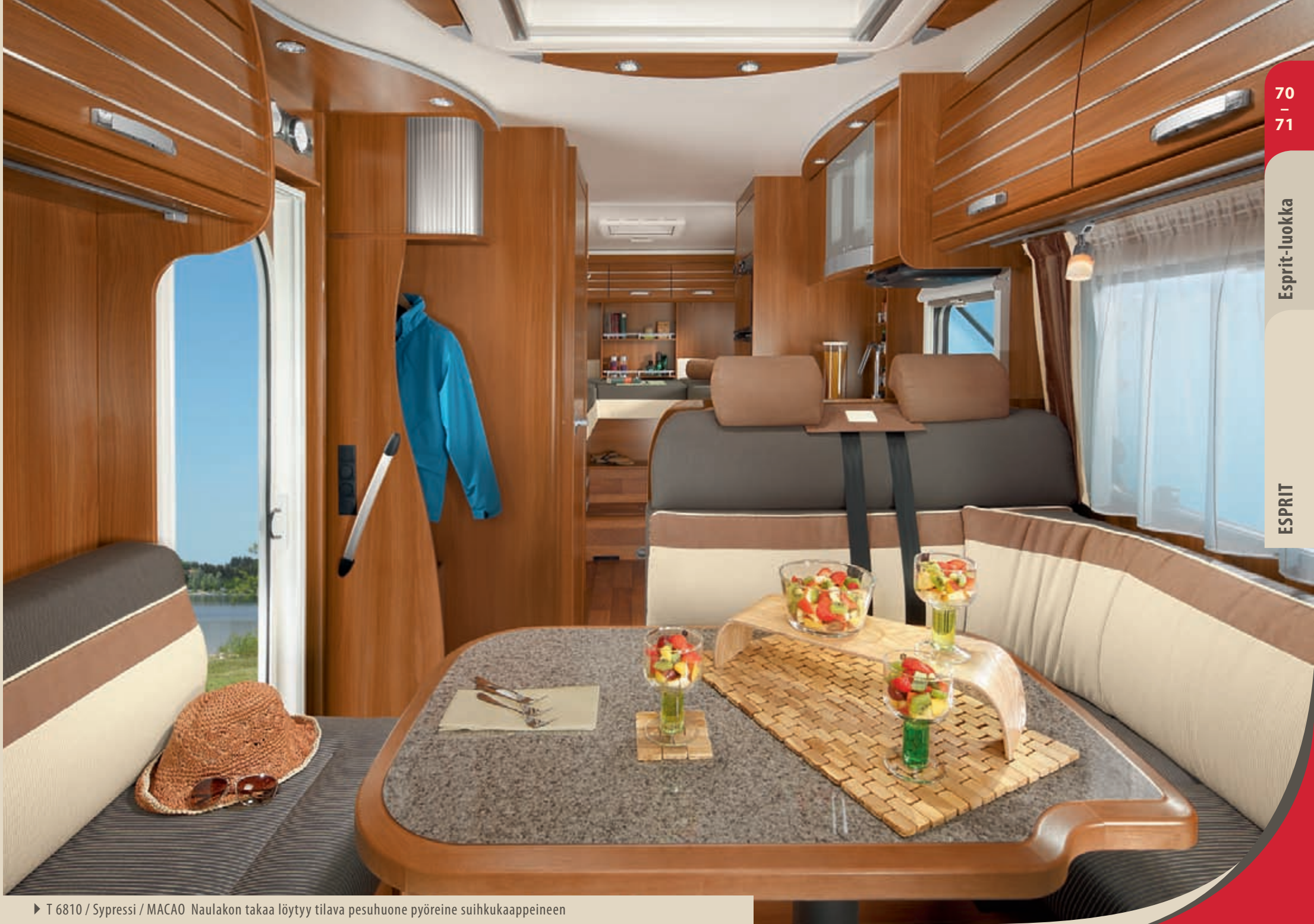
► T 6810 / Sypressi / MACAO Naulakon takaa löytyy tilava pesuhuone pyöreine suihkukaapeineen