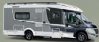
ESPRIT Puoli-integroidut sivu 68