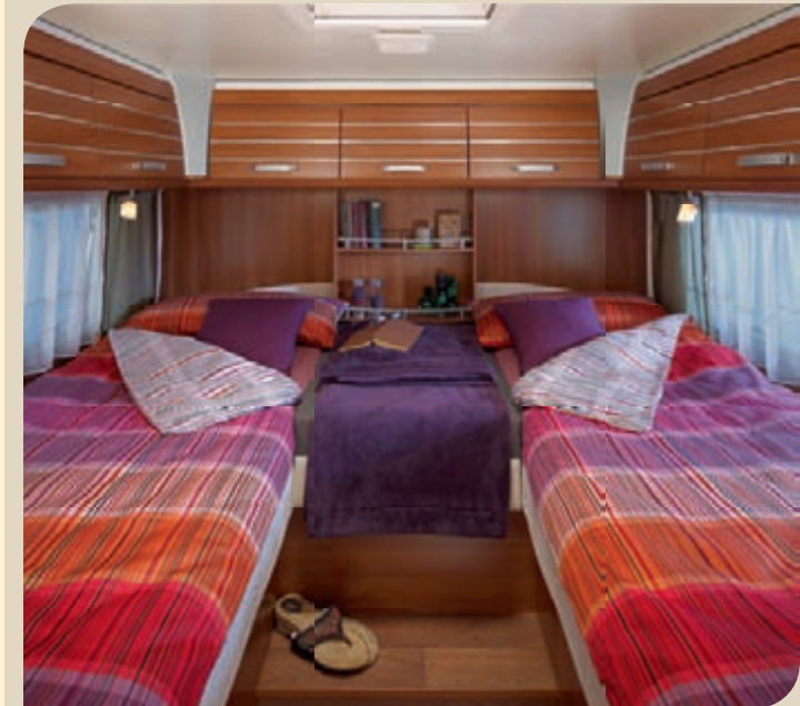
► Erillisvuoteista voidaan helposti tehdä leveä parivuode