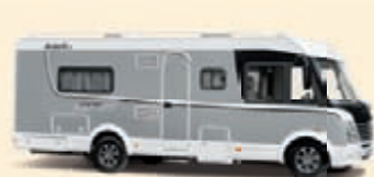
Hopea Koodi-Nr. 1665