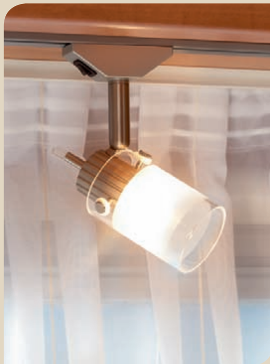
► Irrotettavat lukuvalot