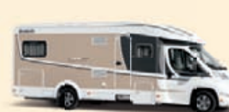
Valkoinen-Maitokahvi Koodi-Nr. 5334