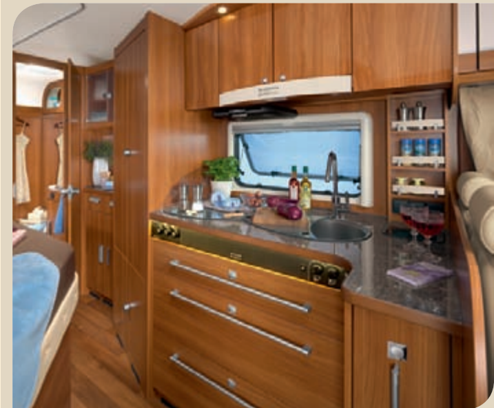
► Gourmet-keittiössä on paljon tilaa