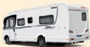
Valkoinen Koodi-Nr. 1999