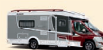
Metallipunainen-Hopea Koodi-Nr. 5340