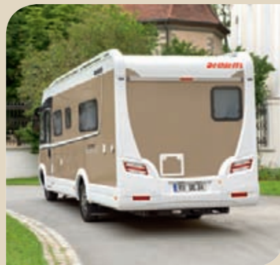
► Integroitu Maitokahvi