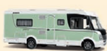
Mintunvihreä Koodi-Nr. 1670