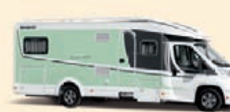
Valkoinen-Mintunvihreä Koodi-Nr. 5336