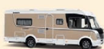
Maitokahvi Koodi-Nr. 1669