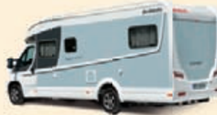
Valkoinen-Vedensininen Koodi-Nr. 5337