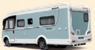
Vedensininen Koodi-Nr. 498