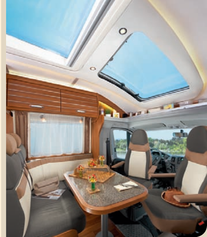
► ESPRIT T -mallin istuinryhmä on valoisa ja tilava