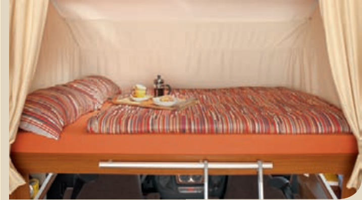
► Maxi-nostovuoteessa on mukava patja ja runsaasti tilaa