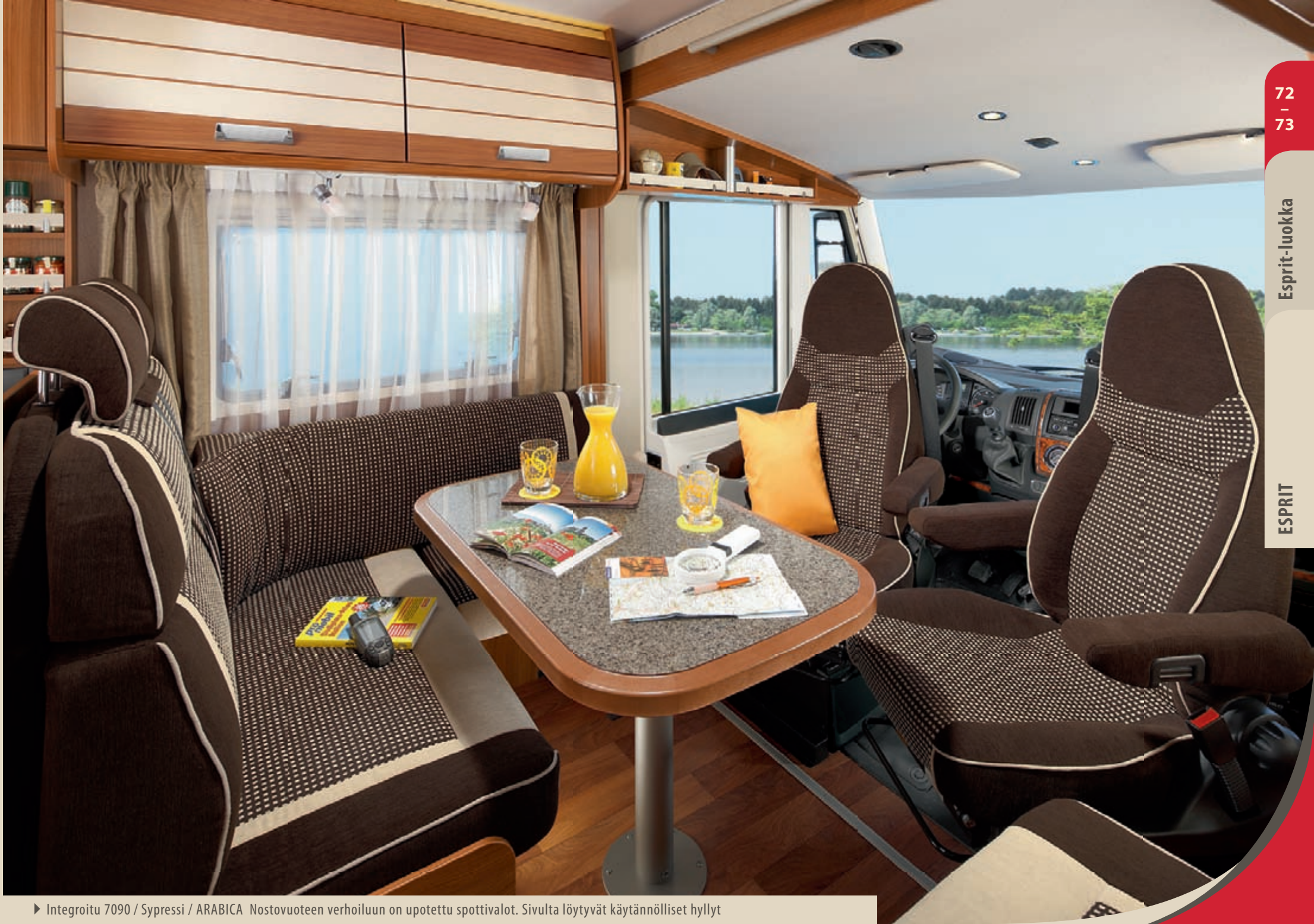
► Integroitu 7090 / Sypressi / ARABICA Nostovuoteen verhoiluun on upotettu spottivalot. Sivulta löytyvät käytännölliset hyllyt