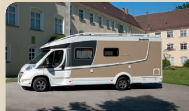
► Puoli-integroitu Maitokahvi