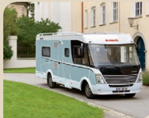
► Integroitu Vedensininen