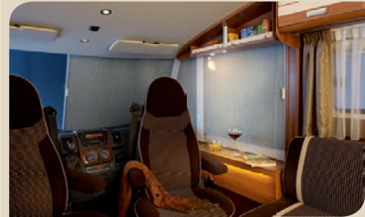
► Pimentää ja eristää: Kaihdinverhot ohjaamossa