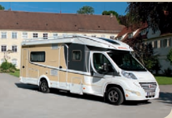
► Puoli-integroitu Hiekanvaalea

Kalustevaihtoehtoja on kaksi ja sisustuksen voi valita yhdestätoista eri tekstiilistä. Saatavana on myös aito korkealaatuinen nahkaverhoilu.