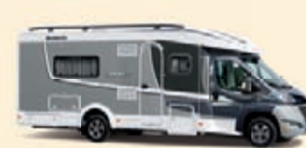
Antrasiitti-Hopea Koodi-Nr. 5339

Tämän sivun kuvien on tarkoitus antaa Sinulle yleiskuva saatavilla olevista mahdollisista väriyhdistelmistä eivätkä ne siis vastaa yksityiskohdiltaan todellista ajoneuvon muotoilua. Värisävyjen ja teippauksien yksityiskohdissa saattaa esiintyä eroavaisuuksia.