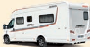
Valkoinen Koodi-Nr. 5713