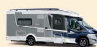
Sininen-Hopea Koodi-Nr. 5706