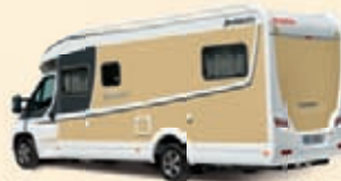
Valkoinen-Hiekanvaalea Koodi-Nr. 5335