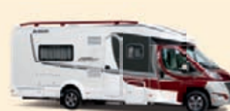
Metallipunainen-Valkoinen Koodi-Nr. 5341