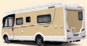
Hiekanvaalea Koodi-Nr. 1671